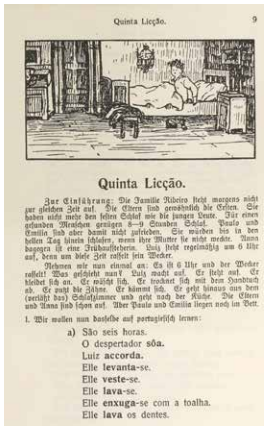
Ilustração nº 1 – Exemplificando o início da lição no livro de Büchler

Além dessas ilustrações centrais, outras figuras menos frequentes, mas com as mesmas características de composição e de utilização aparecem em meio às lições em posições diferentes das páginas.