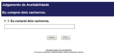
Figura 1: Tela com apresentação da sentença 1, que foi utilizada como módulo do experimento